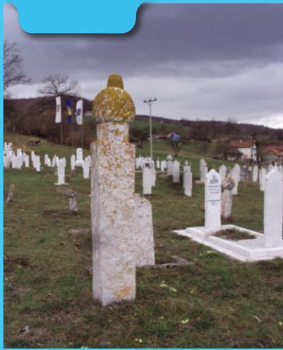
Monumentalni grivički nišan sa turbanom

U okruženju ovog imponantnog nišana nalazi se još sedam nišana iste vrste i oblika samo što su svi daleko manjih dimenzija. Svi oni