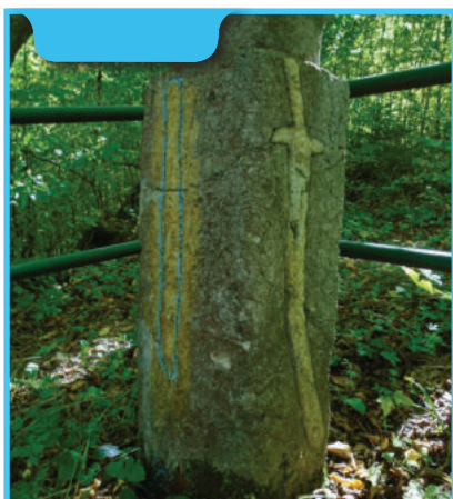
Gazijski nišan Podgora Korča

Ostaci tog nišana se i danas nalaze u neposrednoj blizini mezara.