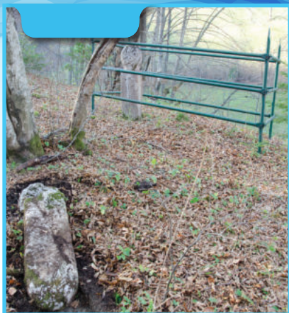
Gazijski nišan Podgora Korča