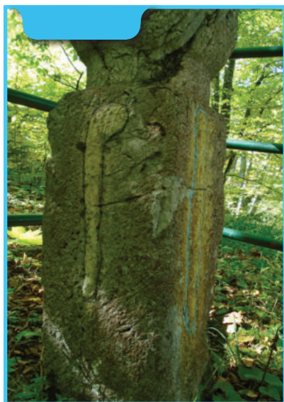
Gazijski nišan Podgora Korča