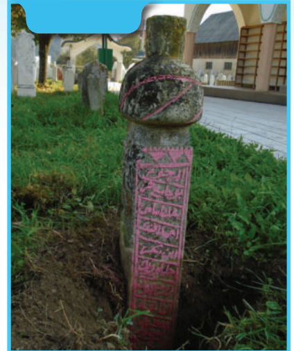
Nišan prvog imamama džamije u Grivićima

Turban je promjera 20 cm. Nišan je rađen od kamena miljevina ili tenelija. Orjentisan je pravcem SI - JZ.